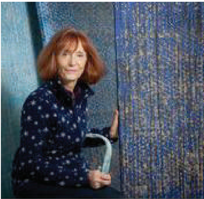
Portrait de l'artiste