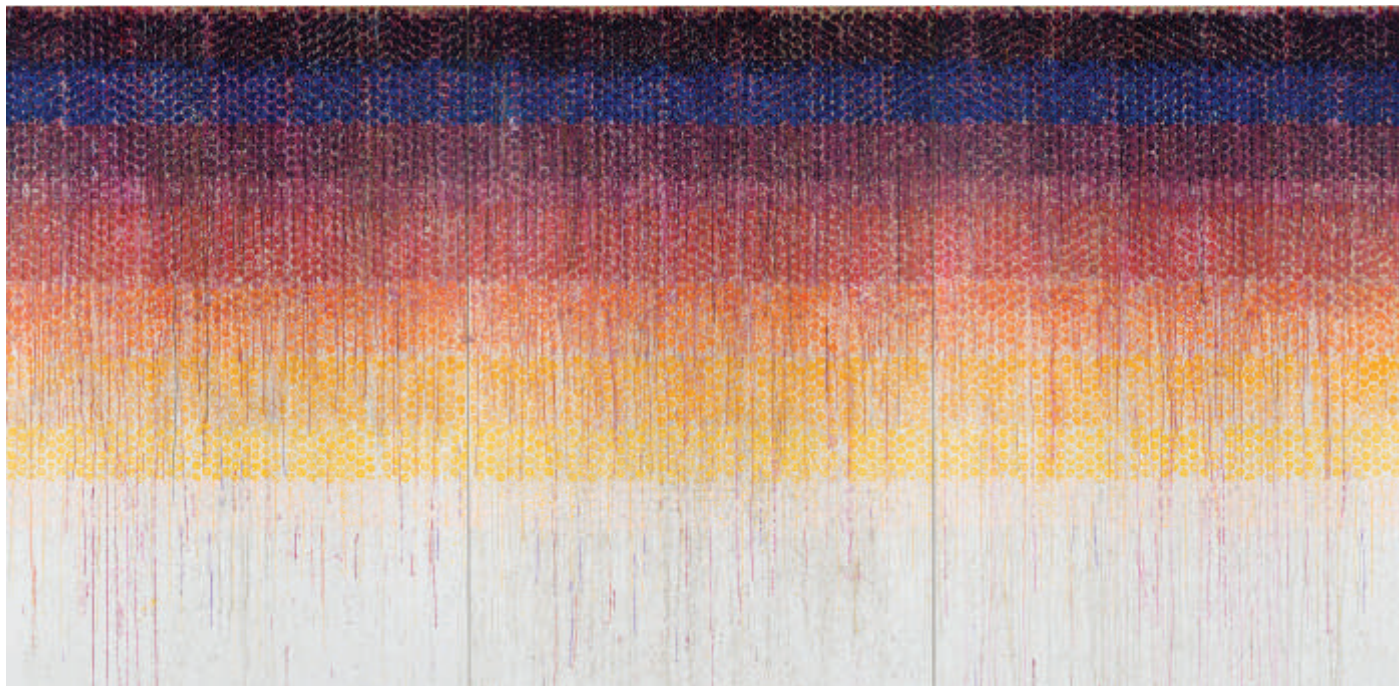
Aurore , 2021, Acrylique sur toile / Acrylic on canvas Triptyque / Triptych 220 x 420 cm / 86.6 x 165.3 in.